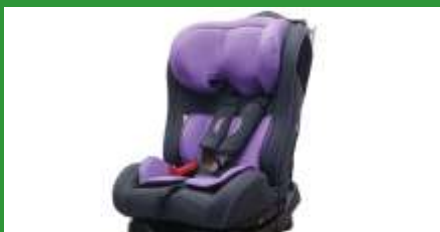
Автокресло группы II для детей массой 15–25 кг