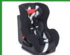
Автокресло группы I для детей массой 9–18 кг