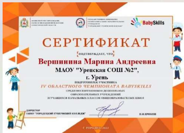
«Подготовка участников областного чемпионата «BabySkills»