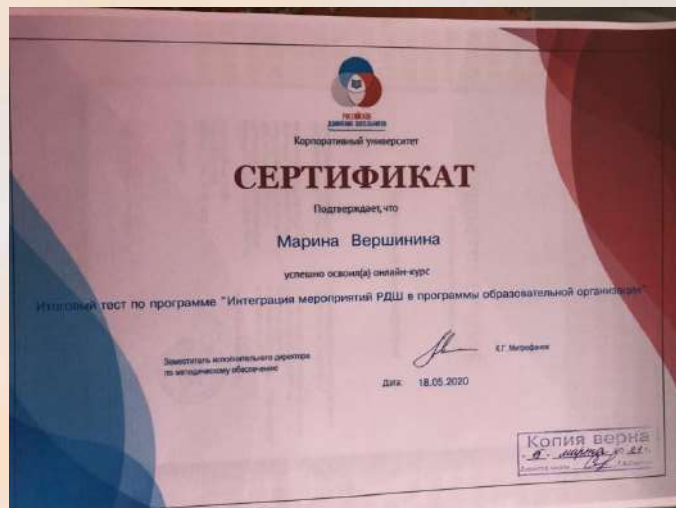
«Интеграция мероприятий РДЦ в программы образовательной организации»