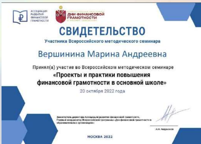
«Проекты и практики повышения финансовой грамотности в основной школе»