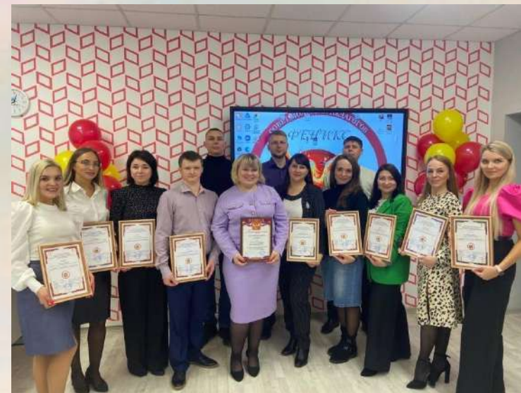
«Седьмой лепесток» – празднование семилетия Совета молодых педагогов «Феникс»