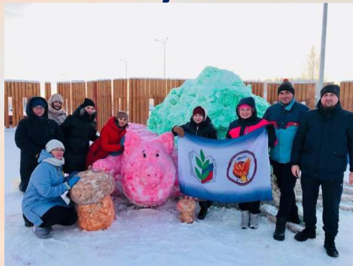
Акция «Снежный городок» Совет молодых педагогов «Феникс»