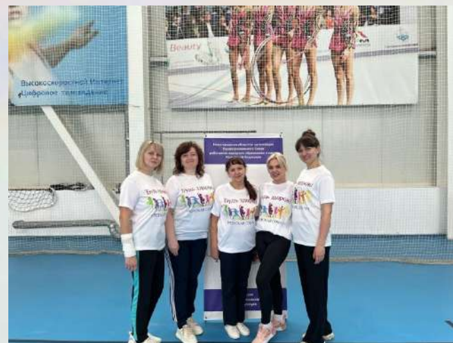
Профсоюзные соревнования по волейболу