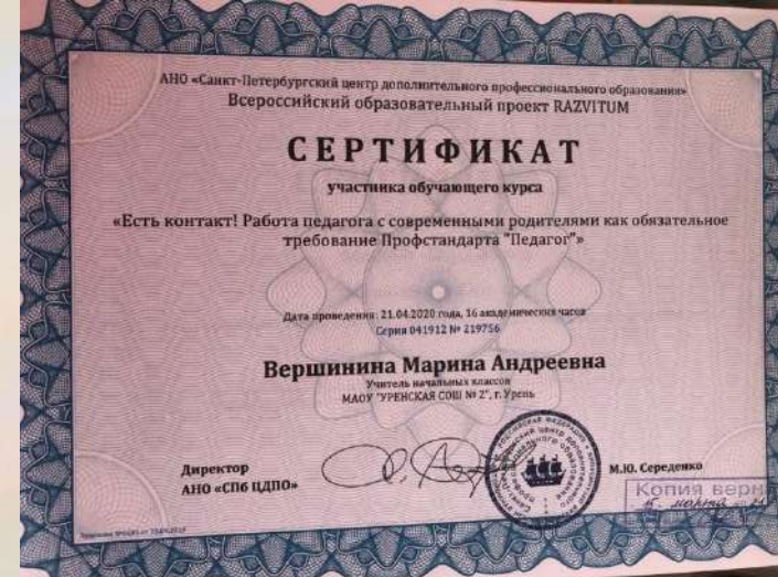
«Есть контакт! Работа педагога с современными родителями как обязательное требование Профстандарта «Педагог»