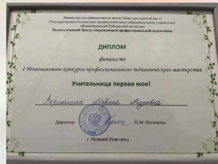
«Финалист регионального конкурса «Учительница первая моя»