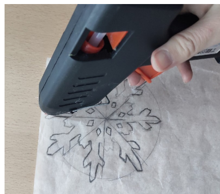
5 этап. Заполняем снежинку клеем.