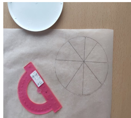
3 этап. Линейкой делим круг на 8 частей..