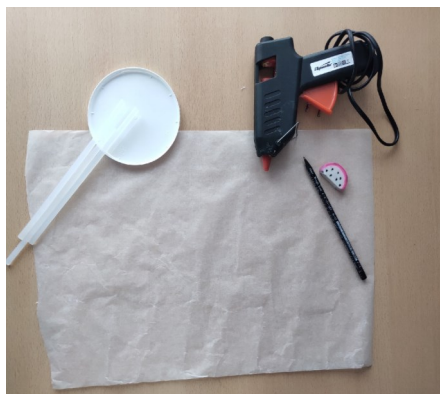
1 этап. Подготовили рабочее место, все инструменты для выполнения работы.

Для работы Вам понадобится: Клеевой пистолет, пергамент (бумага для запекания), карандаш, ластик, круглая форма, линейка.