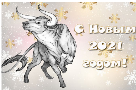
Белый металлический бык. Символ 2021 года!

По восточному календарю 2021 год — год быка. Восточный календарь достаточно интересный. Каждому году соответствует одно из 12 животных. Календарь был изобретен в Китае, но со временем распространился по всему миру. И так, многие народы и сейчас поддерживают его. По нему наступающий 2021 год – это