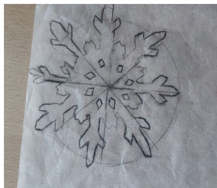
4 этап. Прорисовываем снежинку.