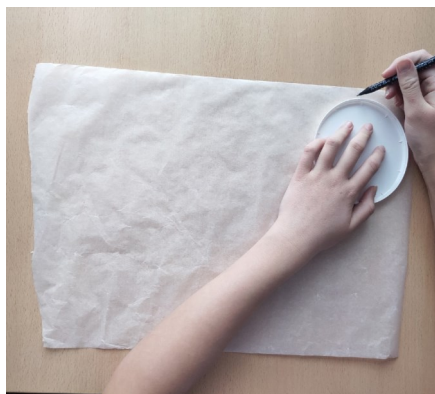
2 этап. Обводим форму..