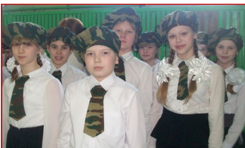
5 «а» класс