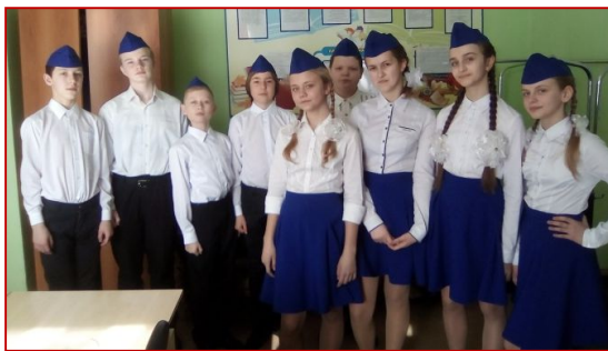
6 «а» класс