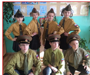
4 «а» класс