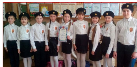
3 «а» класс