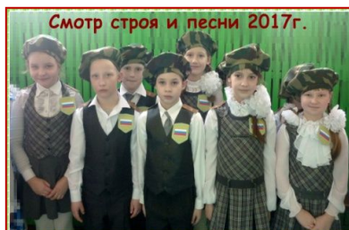
2 «б» класс