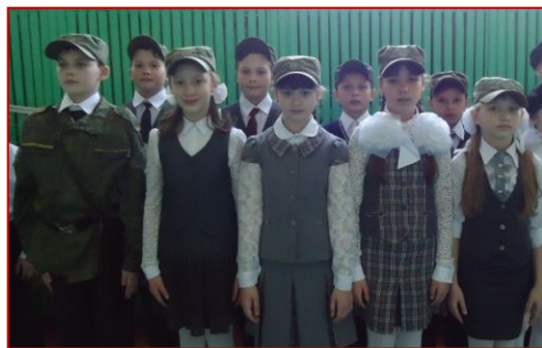
4 «в» класс

В течение нескольких недель команды учащихся готовились к этому дню: разучивали песни, учились ходить строевым шагом, подбирали соответствующую форму. С утра 17 марта повсюду в школе можно было встретить ребят в белых рубашках и кофточках, чёрных брючках и юбочках, И всё это означало, что настал день проведения смотра-конкурса. 13 отрядов начальной школы под звучание гимна РФ выстроились на конкурс. Им предстояло показать свою строевую подготовку, правильность выполнения строевых команд, точность маршировки в колонне, чёткость сдачи рапорта, выразительное исполнение песни и дикционную чёткость речёвки. И, конечно же, не последним критерием оценивания была форма одежды.